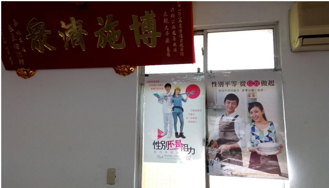
圖二 印製宣導單張張貼