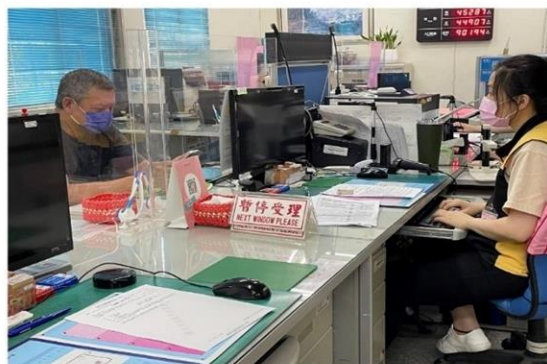
防疫隔板 保持安全距離