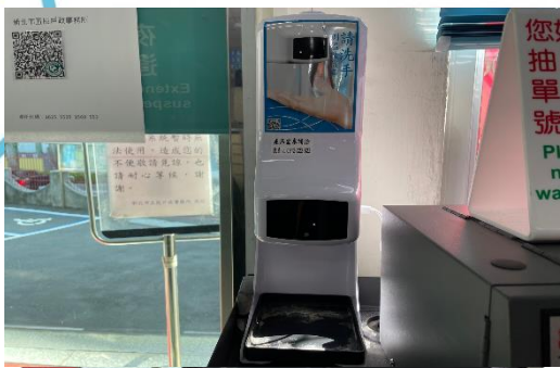
測量體溫/酒精消毒