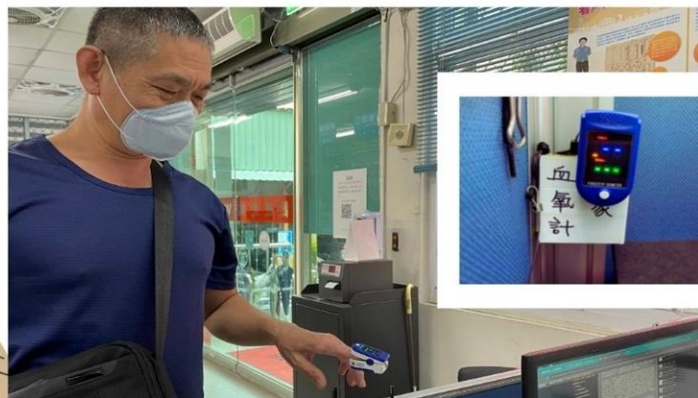
測量血氧關懷健康