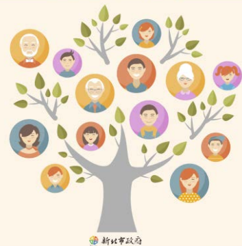
新北市政府民政局數位化族譜網站(試用版)

展出期間吸引大批民眾體驗的數位族譜製作，沒有機會前往體驗的民眾，在新北市政府民政局網站(網址： http://www.familytree.ca.ntpc.gov.tw )就可以輕鬆製作，趕快來體驗喔！