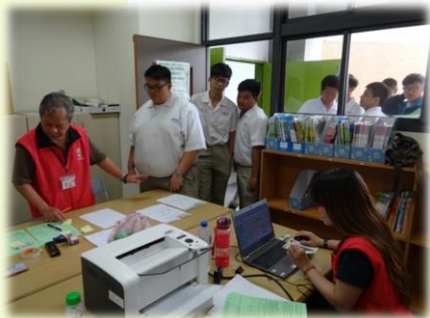
▲ 徐匯中學團辦戶籍謄本