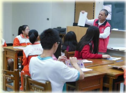
▲ 鷺江國中身分證初領