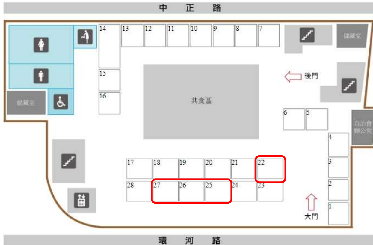
淡水區中正公有零售市場攤(鋪)位圖